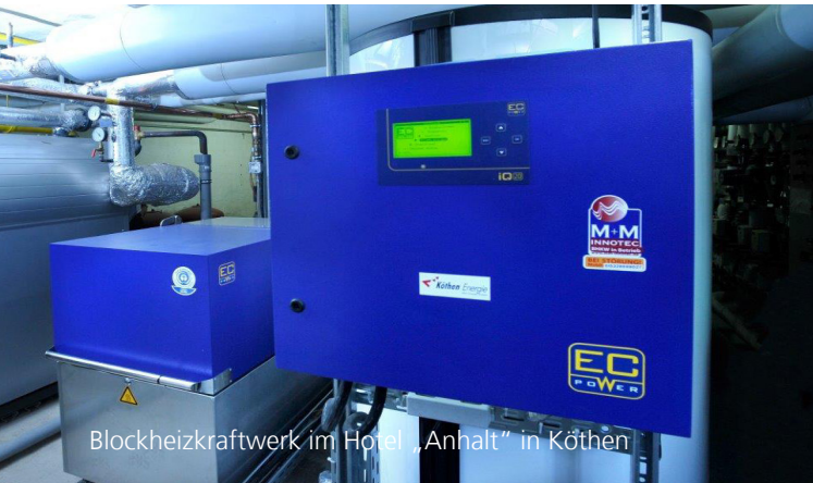
Blockheizkraftwerk im Hotel „Anhalt“ in Köthen