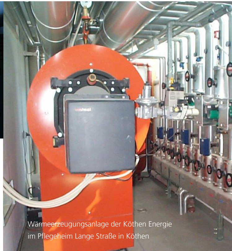
Wärmeerzeugungsanlage der Köthen Energie im Pflegeheim Lange Straße in Köthen

Sie haben einen Ansprechpartner, der sich um alle Belange kümmert.